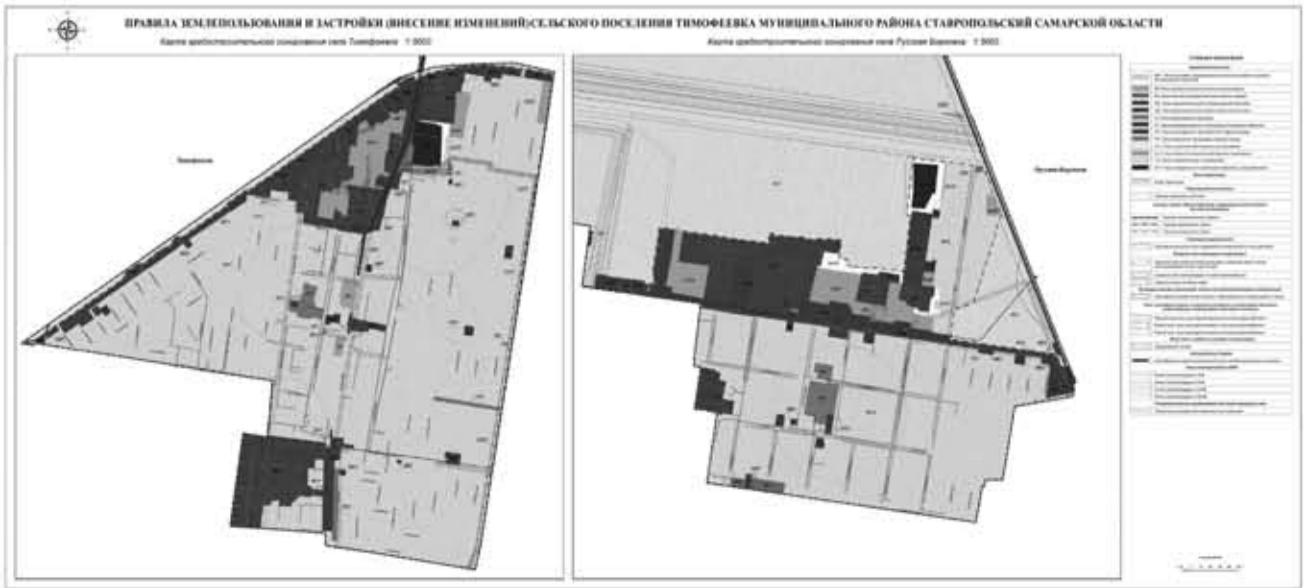
Приложение №1.3 к постановлению администрации сельского поселения Тимофеевка муниципального района Ставропольский Самарский области от 31.10.2022 г. №58