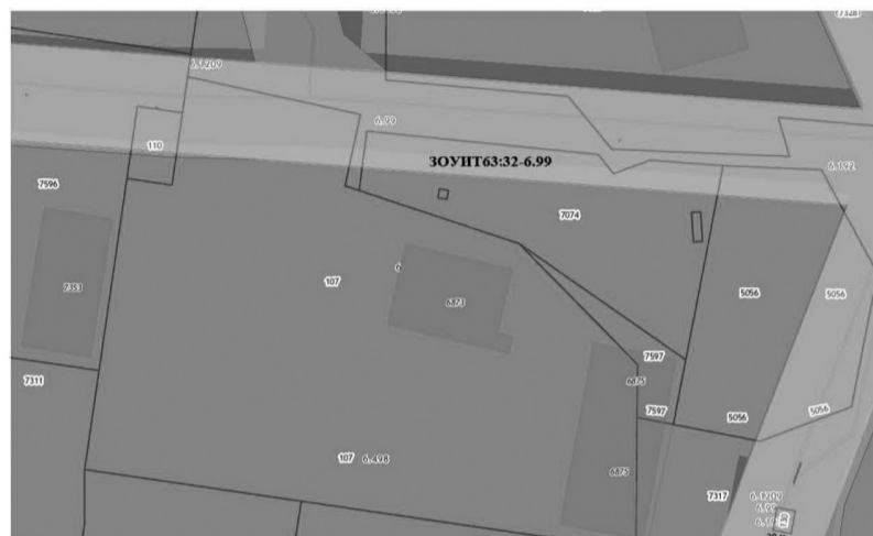
Условные обозначения к Рисунку 6

ЗОУИТ63:32-6.99 - Зона с особыми условиями использования территории охранная зона сооружения - линия электропередачи (ЛЭП) Ф-53 ПС Северная в Ставропольском районе Самарской области