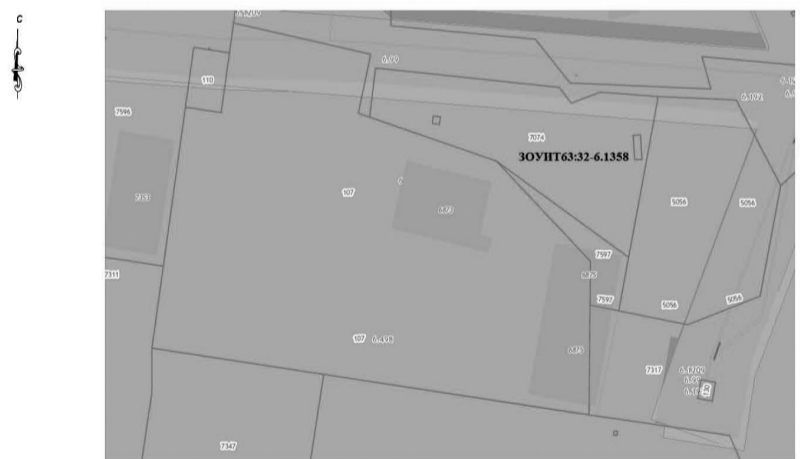
Условные обозначения к Рисунку 3:

ЗОУПТ63:32-6.1358 - Санитарно-защитная зона для действующей площадки №1 АО «Нива» на земельных участках с кадастровыми номерами 63.32:2601001:51 и 63.32:2601001:7317 по адресу: 445140, Самарская область, муниципальный район Ставропольский, село Тимофеевка, ул. Мира, участок № 2-Б