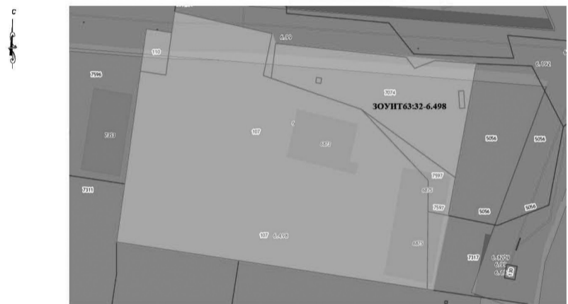
Условные обозначения к Рисунку 2:

ЗОУПТ63:32-6.498 - Санитарно-защитная зона для промплощадки ООО "ЛАДА-ПРЕСС" по адресу: Самарская область, р-н Ставропольский, с. Тимофеевка, ул Энергетиков, 3 на земельных участках с кадастровыми номерами 63.32:2601001:107, 63.32:2601001:110, 63.32:2601001:7074