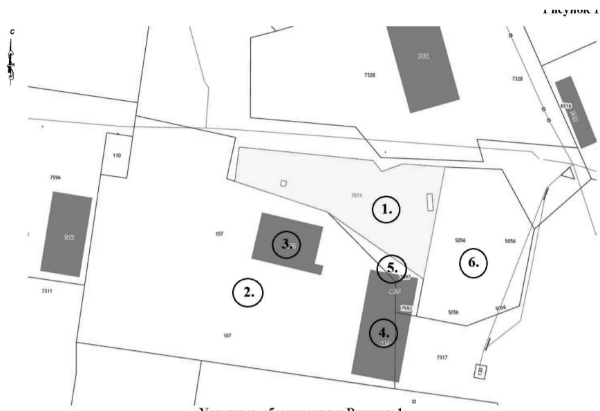
Условные обозначения к Рисунку 1: