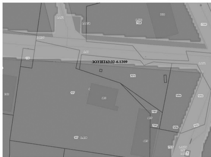
Условные обозначения к Рисунку 5