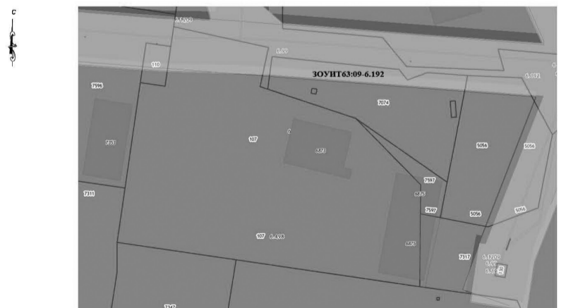
Условные обозначения к Рисунку 4

ЗОУПТ63:09-6.192 - Зона с особыми условиями использования территории. Охранная зона объекта электросетевого хозяйства. Сооружение - часть электросетевого комплекса (ЛЭП) Ф-53 ПС Северная, инвентарный номер 3137, местоположение: Самарская область, г. Тольятти